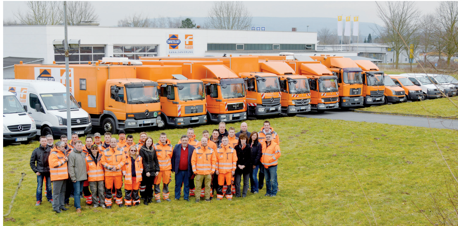
Power-Team aus Lippe: Unter den acht Niederlassungen der Swietelsky-Faber GmbH hat sich die Blomberger Kanalsanierungscrew zur umsatzstärksten entwickelt. Jüngst konnten die Flughäfen Köln/Bonn und Frankfurt als Neukunden gewonnen werden.

Schwerpunkt ist die grabenlose Kanalsanierung (ohne Erdaus-